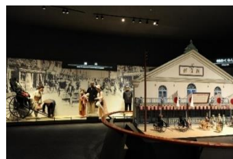
常設展示室（近現代ブース）

平成7(1995)年1月31日の開館以来、「 横浜に生きた人々の生活の歴史 」をテーマに数多くの歴史資料の収集や調査研究をおこない、それらを紹介する展覧会を開催しています。博物館に隣接する国指定史跡「大塚・歳勝土遺跡」を中心とした遺跡公園とあわせて、多くの方にご来館いただいております。