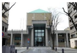
横浜市歴史博物館（外観）