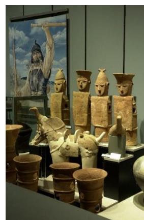
常設展示室（古代ブース）