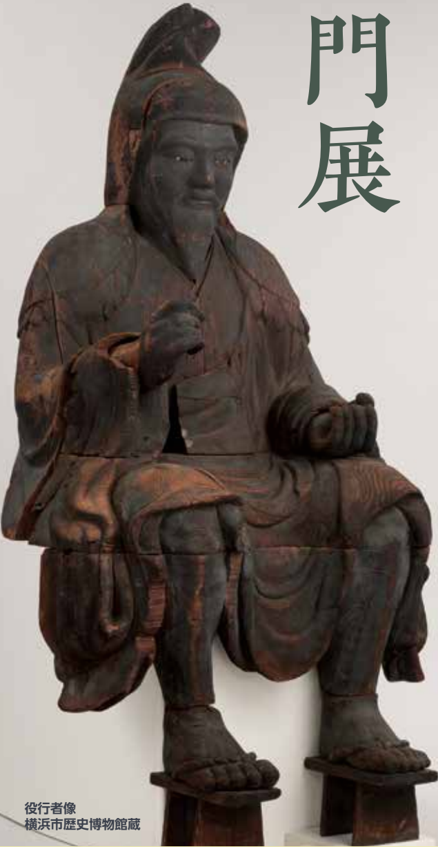
役行者像 横浜市歴史博物館蔵