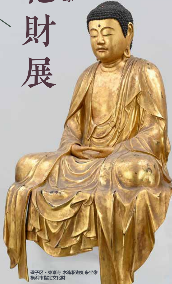
磯子区・東漸寺 木造釈迦如来坐像 横浜市指定文化財