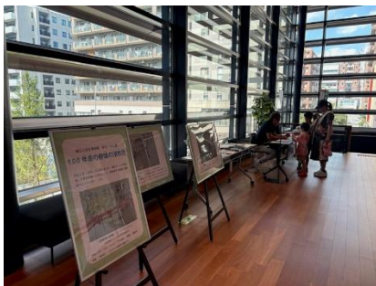
ボッシュホールでのパネル展示