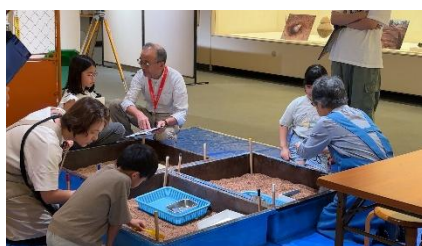
ボランティアによる発掘体験補助