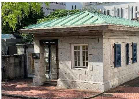
ミュージアムショップ&カフェ「PORTER'S LODGE」

施設利用者の利便を図るため、敷地内に飲料自動販売機を設置し、飲み物を販売します。