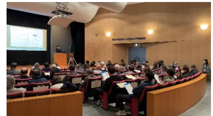
都筑図書館・都筑区連携講演会