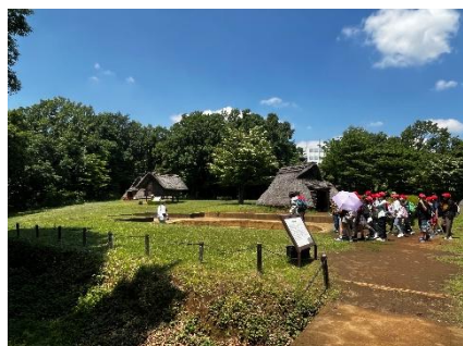
ボランティアによる大塚遺跡ガイド