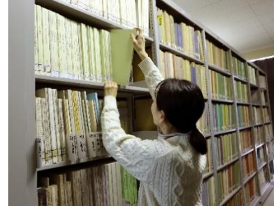
図書等の収集・受入れ・整備