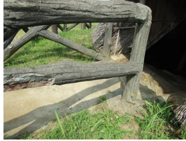
復元住居柵破損補修