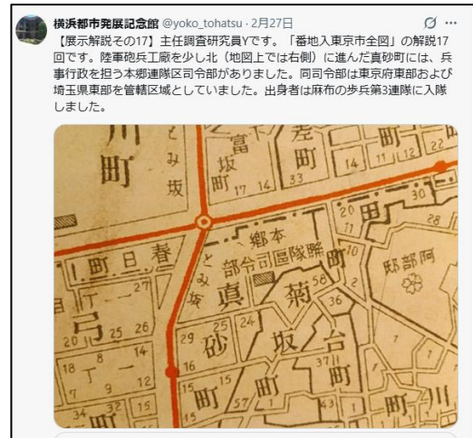
SNS を活用した情報発信