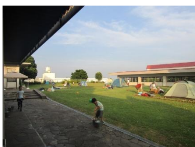
キャンプ in 三殿台