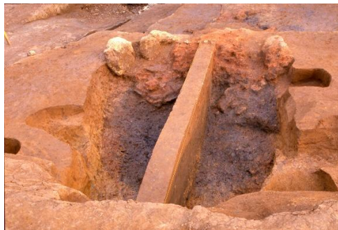
栄区上郷深田遺跡の古代製鉄炉