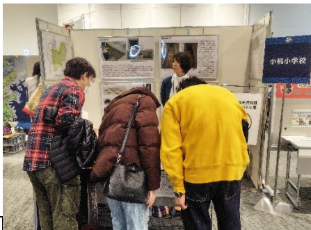
お城 EXPO への出展