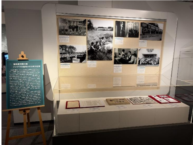
常設展示室コーナー展