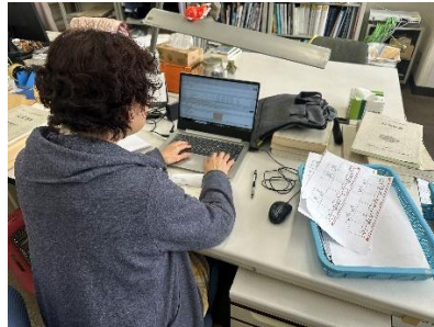
出土品保管再整備作業