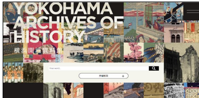
デジタルアーカイブ