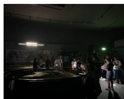
ナイトミュージアム