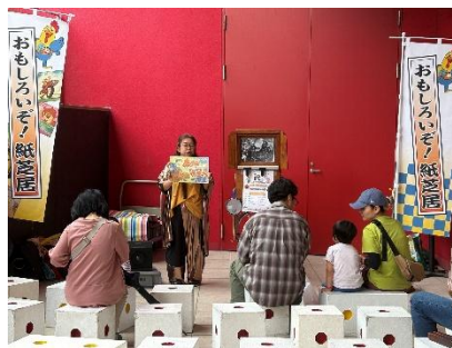
センター中央文化祭：紙芝居