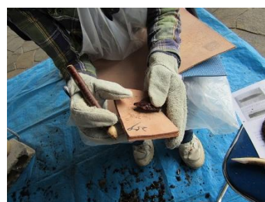
石器作り体験教室