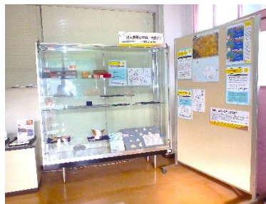
埋文センターエントランス展示