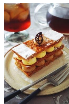
「たまくすの木」 ミルフィーユ