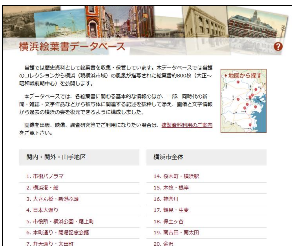
横浜絵葉書データベース

複製資料(所蔵資料の画像データ)を提供し、出版・放送・展示や市民の学習など、各種用途での利用に応じます。