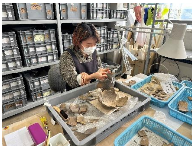
出土品整理作業（土器復元）