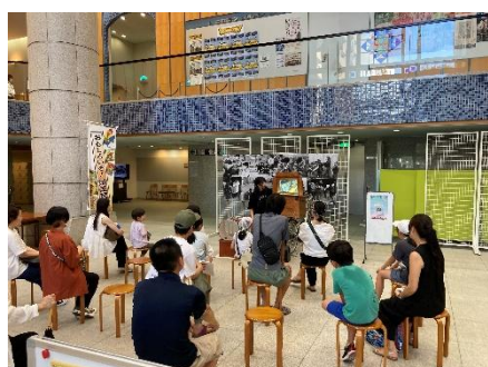
紙芝居デビュー講座