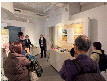
横浜の遺跡展（都市発展記念館）