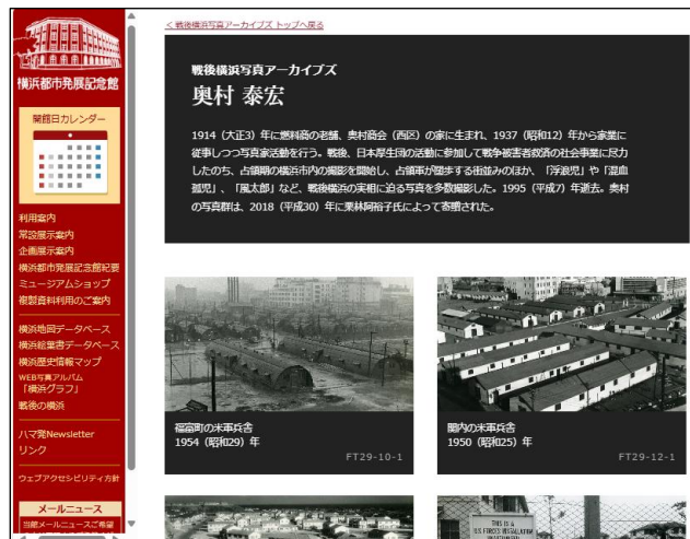
戦後横浜写真アーカイブズ